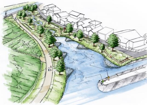
出来上がったパース絵 その1