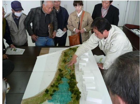
模型を囲んでの説明

に設計を行いました。河床高など模型と現地とに違いがある箇所については、現地の状況に合わせて設計を行ったとのことです。