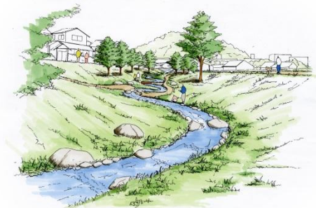
出来上がったパース絵 その2

説明の後、皆さんにパース絵を確認いただきました。概ね、皆さんのイメージ通りのパース絵になっていたのではないのでしょうか。