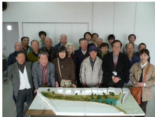
模型を囲んだ参加者の皆さん