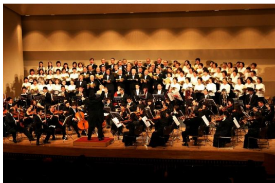
盛んな文化芸術活動（「第九」演奏会）

少子高齢化の進行や市民ニーズの多様化で変化が求められる中、古賀市では、農業や商工業の活性化、防災や環境保全による安全・安心なまちづくり、子育て支援や学校教育の充実、健康づくりや介護予防、高齢者や障がい者の社会参加の支援など、様々な施策に取り組んでいます。