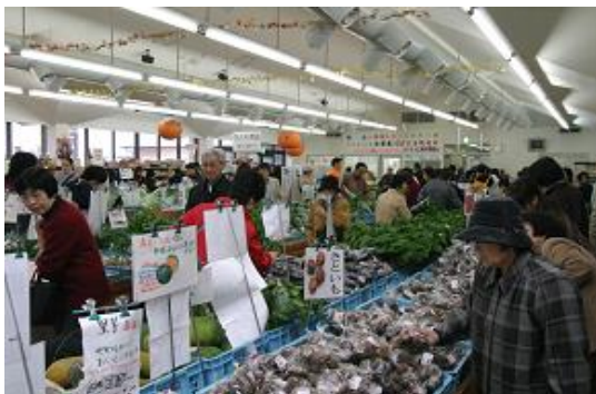
古賀市で採れた野菜が集まる「コスモス広場」

現在は九州自動車道のインターチェンジや2本の国道、3つのJR駅を有し、優れた交通アクセスを生かして工業団地や住宅団地が立地し、便利で快適な生活環境が整っています。