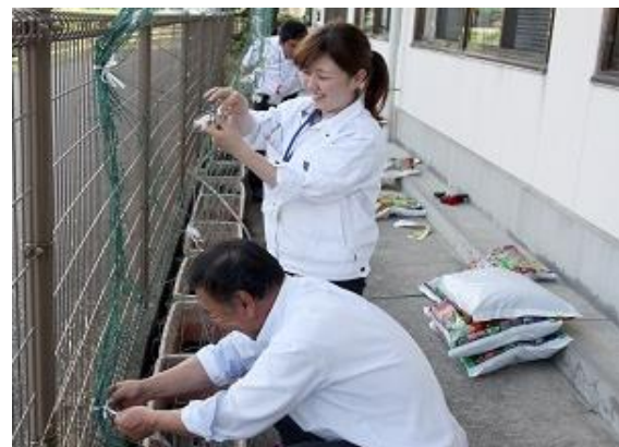
グリーンカーテンの取組み

市役所には、地域の方々の笑顔をみることができる、やりがいを感じることができる仕事がたくさんあります。古賀市をさらに良いまち、笑顔いっぱい元気なまちにしていくため、皆さんも職員として私たちと一緒に働いてみませんか？