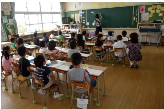
多彩な人員配置を先行実施し、豊かな学びをサポート