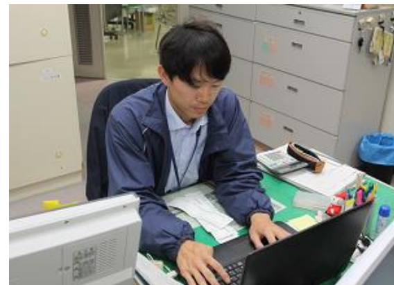
パソコンで名簿を作成中

日々の業務では、たくさんの市民の方と接します。一人ひとりとの出会いを大切に、一期一会をモットーにして、市民の皆さんが笑顔になっていただけるよう日々働いています。