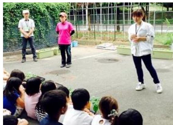
小学校での授業の様子