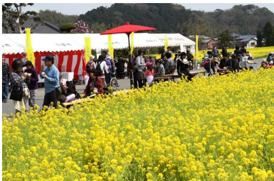
春の恒例「なの花まつり」はウォーキングにも最適