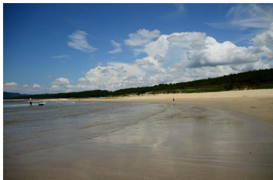
白砂青松の古賀海岸