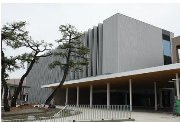
平成28年8月2日に開館する リーパスプラザこが 交流館