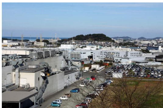
製造品出荷額は県内第9位、食品関係では第2位