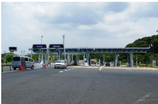
物流の要、古賀インターチェンジ

現在は九州自動車道のインターチェンジや2本の国道、3つのJR駅を有し、優れた交通アクセスを生かして工業団地や住宅団地が立地し、便利で快適な生活環境が整っています。