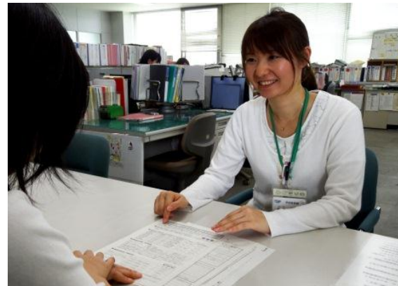
窓口では丁寧な対応を心がけています