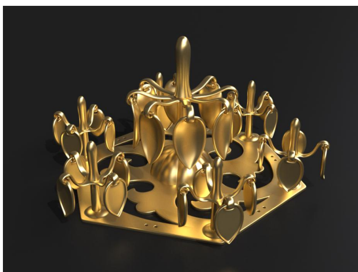
平成25年、古賀市谷山で発見された金銅製馬具の復元予想図 (九州国立博物館作成)