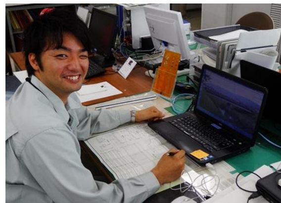
職場で図面を確認しているところ

市役所の業務は多岐に渡るため数多くの部署がありますが、どの部署でも古賀市をより良いまちにするために働くことができます。一緒にがんばりましょう！