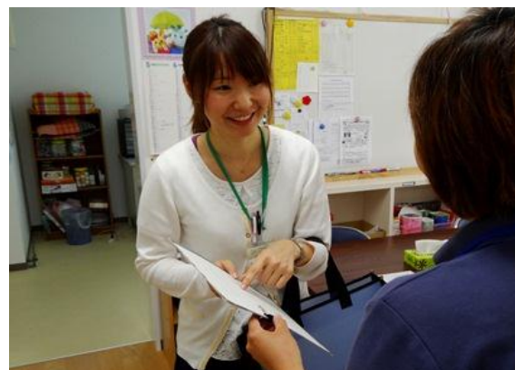
学童保育所で指導員の先生と打ち合わせ