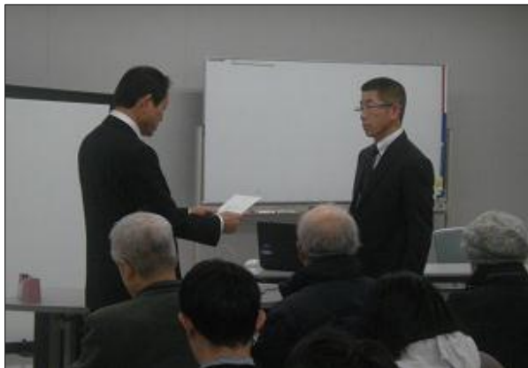
市長から策定委員に委嘱書が手渡されました

この「自治基本条例だより」では委員会の活動や条例の検討状況をお伝えしていきます。