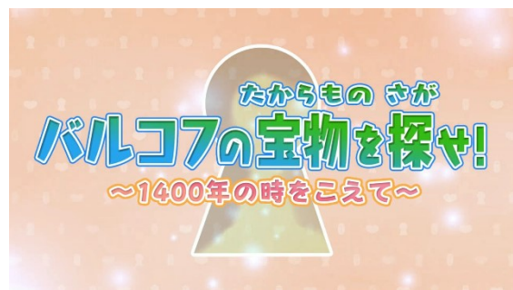
「バルコフの宝物を探せ！」