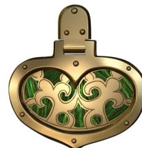
▲CGで復元したイメージ (二連三葉文心葉形杏葉)

令和5年3月で船原古墳の土坑から遺物が出土して10年。「船原古墳の宝」を題材に、小学校で授業を行うことで、船原古墳をより身近に感じ、知ってもらうことを目的としています。