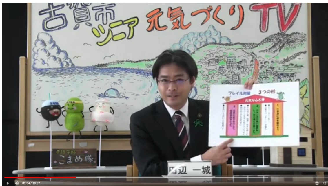
■オリジナルポスター（上）、YouTube 動画「古賀市家トレチャンネルゆい」（下）