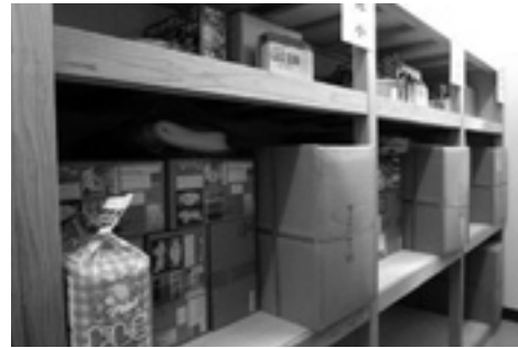
備蓄場所の分散など対応が必要 (東小)

問 災害時には自治体の災害備蓄品が大きな力を発揮する。特に備蓄食糧はお年寄りや乳幼児など、体力がない被災者にとつて避難後の命をつなぐ大事な物資である。乳幼児に多い食物アレルギーの対応は、 市長 現在対応していないが、今後は必要と考える。 問 アレルギー用粉ミルクや、アルファ米を備蓄品に加え、さらに、支援物資の受け入れも、一般物資と混合しないよう医薬品として取り扱うべき。 総務部長 誤れば命の危険あることを十分認識し検討する。 問 市民の防災意識を高めるために備蓄品の活用は。 市長 防災訓練等で使用。今