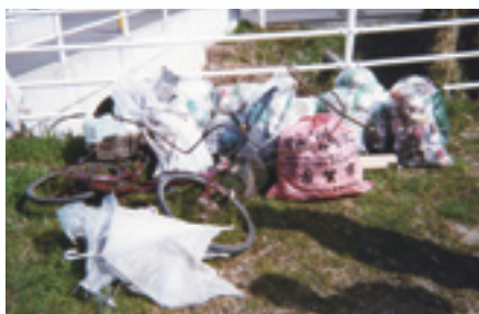
モラルが問われる回収されたごみの一部