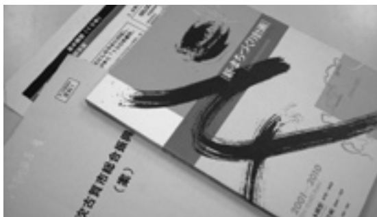
どうなる第4次総合振興計画

問 就任後半が過ぎようとしている中、まちの最上位計画がない異例の事態である。 市長 基本構想の都市イメージ、目標人口はほぼ固まったが、土地利用の方針については現在検討中。 問 白地地域の市街化調整区域編入を延期することによる影響をどう考えるか。 市長 可否についての判断はしていない。 問 マニフェスト大会に出席しなかったのはなぜか。 市長 参加するより、このような(リーフレット)形で表現させていただいた。 問 国際文化企画を閉鎖するための総会には出席されたか。