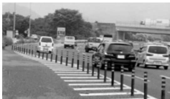
インターチェンジの有効活用を

問 2009年に作成された都市計画マスタープランには、古賀の自然環境を守っていくため、農業や自然環境に配慮しながら無秩序な開発を抑制