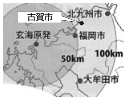
意外と近い古賀市と玄海原発の距離

問 市民を守るために原発依存をやめ、自然・再生可能エネルギー利用を要望する。 新隣保館建設は必要ない 問 現隣保館をなぜ建替えるのか。研修棟などが優先では。 市長 隣保館は必要と認識。 問 新隣保館は市民の要望。建設をやめ、市長選公約の子ども医療費拡大などの実現を。 コミュニティバスが必要 問 「通院・買い物に公共交通がほしい」との声。隣保館のお金はあつても、コミュニティバスのお金はないのか。 市長 西鉄への補助は最良の選択。公共交通は別と認識。 問 認識は別でも、金の出どころは一緒。予算は市民のために。ぜひコミュニティバスを走らせてほしい。