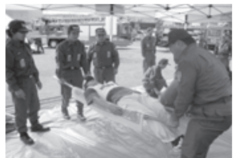
宗像市田島地区での防災訓練

副市長 自主防災組織が大変重要で必要だと言う認識は持っている。できれば早急に、全ての地域において組織されるのが望ましい。今まで以上に力を入れて取り組みたい。