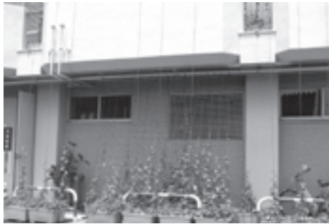
グリーンカーテンで省エネ (古賀市役所)

総務部長 山崎製パン、ファウンテン・デリ、サンデリカ、イオン九州、サンリブ古賀と