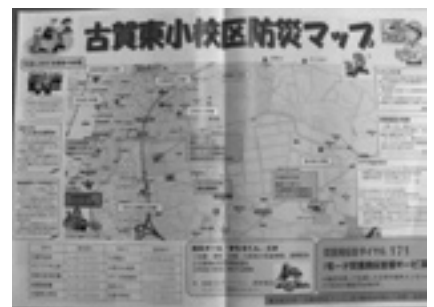
急がれる地域での防災マップ作り