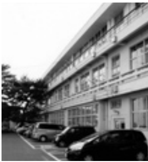
建て替えが待たれる研修棟

とは決めておらず、NPOを立ち上げて頂き、運営をしてもらうなどの検討をしている。 問 体育施設の現状と課題は。 教育長 登録団体の利用が、7割から8割を占めている。市民が自由に利用できる、施設開放日の設定の検討をする。