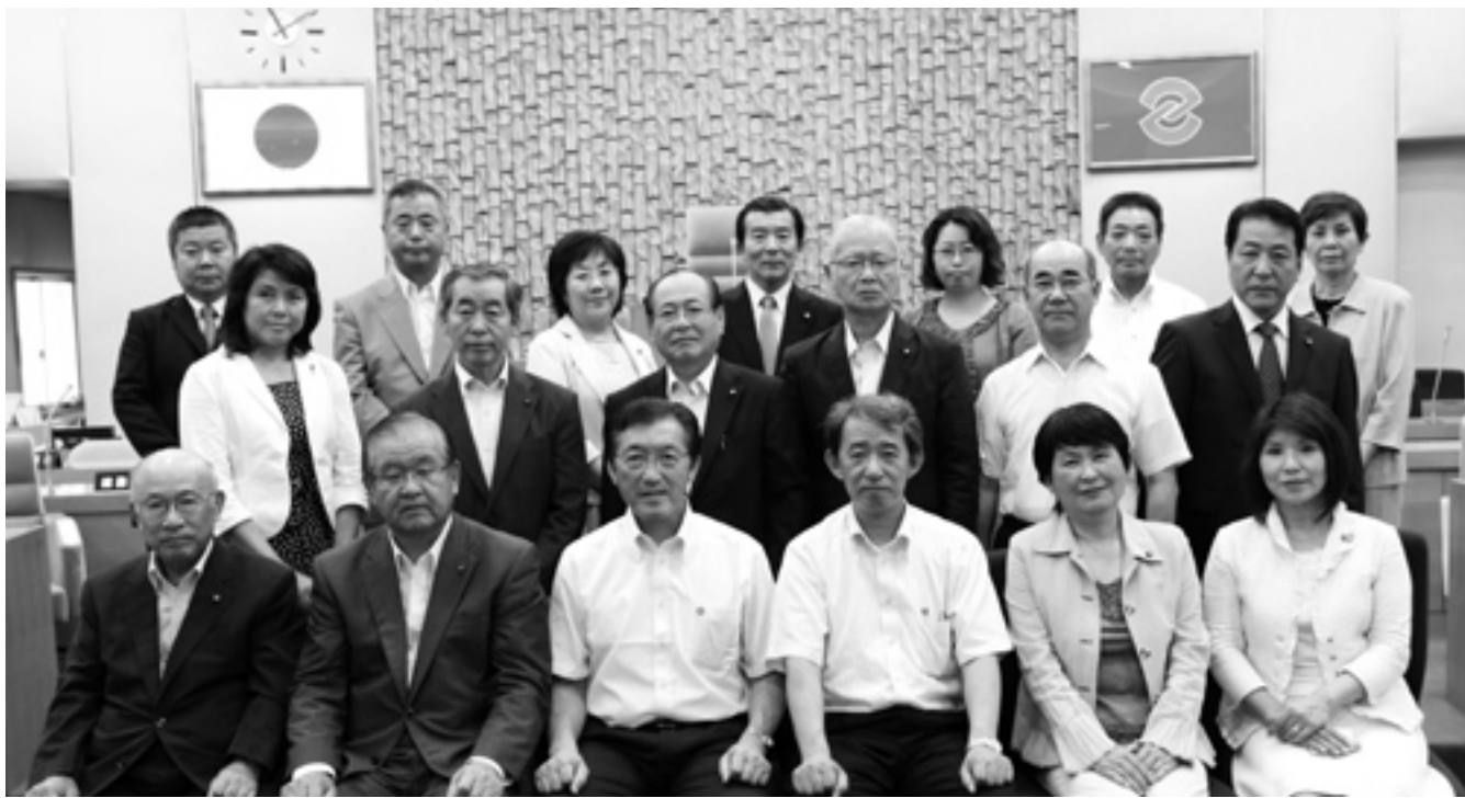
19人の古賀市議会議員（平成 23 年 6 月 22 日 議場内）