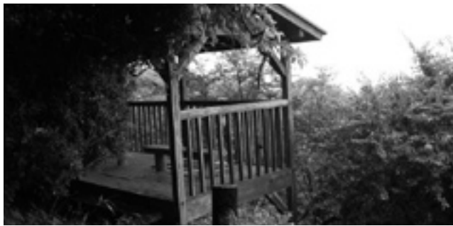
植栽が茂り、見晴らしが悪い展望台