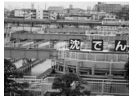
東京都の上水道にも汚染が

問 防災計画の屋内退避や避難の基準は、どのような方法で確認するのか。 総務部長 放射線測定器等は持つていない。今後購入等について検討したい。 問 市役所本庁が災害時は情報の統括、指示、指令の中心となる。食料備蓄などの対応はされているか。 総務部長 そこまで対応していない。市役所が災害対策本部になるので、今後検討したい。 問 震災から自然エネルギーの活用は省エネルギーにもつながる重要な課題になっている。利用も広がっている太陽光発電補助の見直し、燃料電池補助の新設などを検討すべきでは。 市長 ご意見として承る。