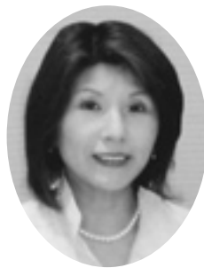
芝尾 郁恵 (公明党)